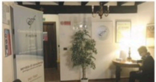
Un protocollo operativo regola l'accesso alla sede e ai servizi nel rispetto delle norme di gestione del Covid